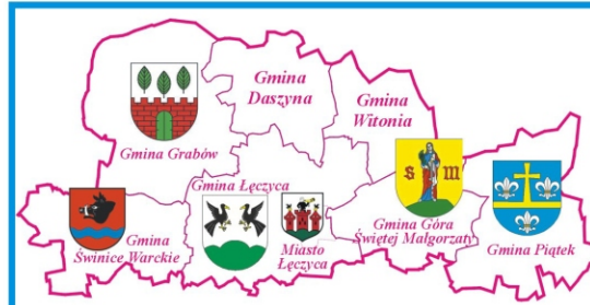
Podział administracyjny powiatu łęczyckiego